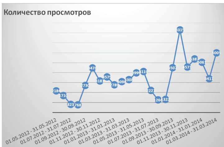
Диаграмма 1. Количество запросов в поисковой системе Яндекс про движение «Суть Времени»

Как демонстрирует Диаграмма 1, в указанный период было запрошено и просмотрено 78826 сообщений.